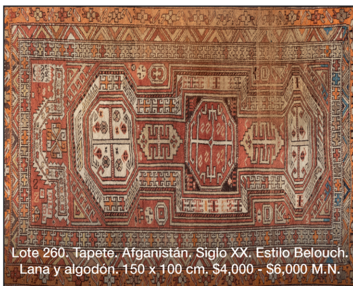
Lote 260. Tapete. Afganistán. Siglo XX. Estilo Belouch. Lana y algodón. 150 x 100 cm. $4,000 - $6,000 M.N.