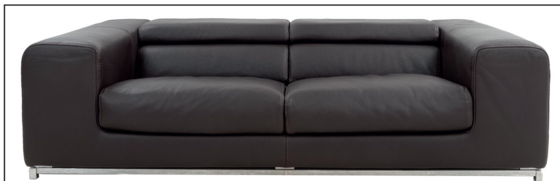
Lote 250. Loveseat de la firma Roche Bobois. Modelo Initial. Francia, siglo XXI. Tapizado en piel con respaldos ajustables. $30,000 - $40,000 M.N.