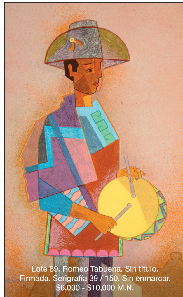
Lote 89. Romeo Tabuena. Sin título. Firmada. Serigrafía 39 / 150. Sin enmarcar. $6,000 - $10,000 M.N.