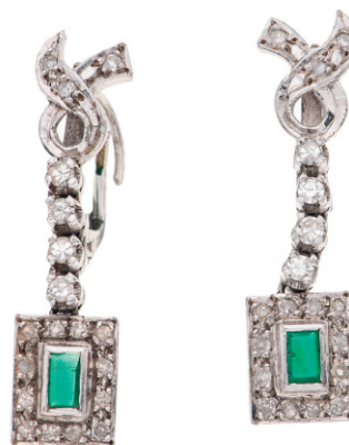
Lote 63. Par de aretes con esmeraldas y diamantes en plata paladio. $2,800 - $3,500 M.N.